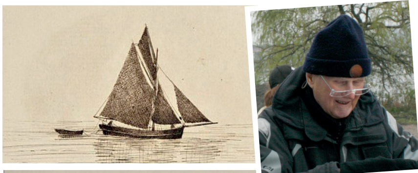
Jag minns en äldre man från Lidingö Runt 2012.